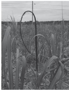
黒穂病に罹った さとうきび