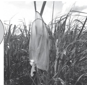
ビニール袋を被せて抜き取る